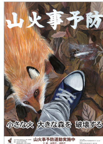
「全国山火事予防運動」ポスター