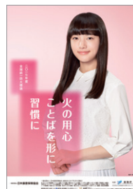
平成29年度 全国統一防火標語ポスター

この火災予防運動にあわせて、山火事予防に対する意識を高め、森林の保全と地域の安全に資することを目的とした「全国山火事予防運動」を林野庁と共同で実施します。